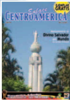
Monumento al Divino Salvador del Mundo, San Salvador, El Salvador

Francois de la Rochefoucauld (1613-1680) Escritor francés